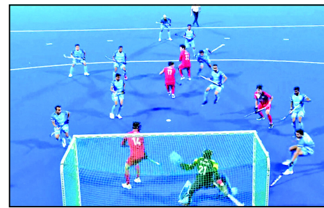
ଫାଇନାଲରେ ଅପରାଜେୟ ଭାରତୀୟ ହକି ଟିମ୍