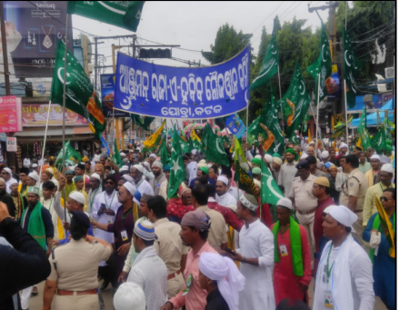
ପତାକା ଓ ପାଲେଷ୍ଟାଇନ ସମର୍ଥନରେ ଥିବା ପ୍ଲାକାର୍ଡଗୁଡ଼ିକୁ ଜବତ କରିଥିବା ଜଣାପଡ଼ିଛି ।

କଟକ: କଟକରେ ମହାପୁରୁଷ ମହମ୍ମଦଙ୍କ ଜୟନ୍ତୀ ତଥା ଇନ୍ଦ୍ର-ଏ-ମିଲାନୁନ-ନବୀ ପାଳିତ ହୋଇଯାଇଛି । ଏଥିପାଇଁ ବିଭିନ୍ନ ସ୍ଥାନରେ ବିଶାଳ ଶୋଭାଯାତ୍ରାର ଆୟୋଜନ କରାଯାଇଥିଲା । ଯେଉଁଥିରେ ଫ୍ରି ପାଲେଷ୍ଟାଇନ ପ୍ଲାକାର୍ଡ ଏବଂ ପତାକା ଉଡ଼ୁଥିବାର ଅଭିଯୋଗ ହୋଇଛି । ମହମ୍ମଦ ଜୟନ୍ତୀ ଅବସରରେ କଟକର ବିଭିନ୍ନ କମିଟି ଚରମକୁ ବଦଳି ଶୋଭାଯାତ୍ରା ବାହାରି ସହର ପରିକ୍ରମା କରିବାର ପରମ୍ପରା ରହିଛି । ସୋମବାର ସହରର ବିଭିନ୍ନ ମୋହଲା କମିଟି ଚରମକୁ ଏହିଭଳି ଶୋଭାଯାତ୍ରା ବାହାର କରାଯାଇ ସହର ପରିକ୍ରମା ସମୟରେ ଭାରତୀୟ ପତାକା ଉଡ଼ୁଥିବାର ଅଭିଯୋଗ ଦିଆଯାଇ କାଟାୟ ପତାକା ଉଡ଼ୁଥିବାର ଅଭିଯୋଗ ହୋଇଛି । ଏଥିସହ ଶୋଭାଯାତ୍ରାରେ ଯାଉଥିବା ଶୁଖାଲୁକ୍ ହାତରେ ଫ୍ରି ପାଲେଷ୍ଟାଇନ ଓ ପ୍ରେ ଫର ପାଲେଷ୍ଟାଇନ ସ୍ଲୋଗାନ