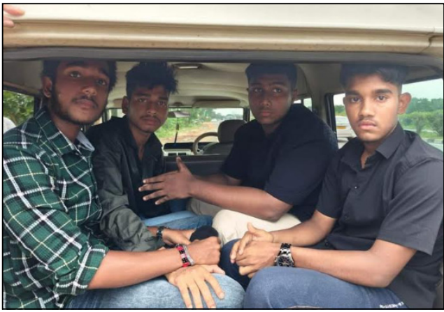
ଭୁବନେଶ୍ୱର(ନିପୁ): ରାଜଧାନୀର ବେପରୁଆ ଗାଡ଼ି ଚାଳନା କରିଥିବା ଅଭିଯୁକ୍ତଙ୍କୁ ବାନ୍ଧିଲା ଜନପଥରେ ପ୍ରାଥମିକ ନିୟମ ଉଲ୍ଲଙ୍ଘନ କରି ମନ ଭଙ୍ଗା ପୋଲିସ୍ । ଘଟଣାରେ ମୋଟ ୫ ଜଣ ଗିରଫ

ହୋଇଥିବାବେଳେ ୨ଟି ଗାଡ଼ି ଜବତ କରିଛି କମିଶନରେଟ୍ ପୋଲିସ୍ । ଏଥିସହ ଅନ୍ୟ ଅଭିଯୁକ୍ତଙ୍କୁ ମଧ୍ୟ ଖୁବଶୀଘ୍ର ଧରିଯିବ ବୋଲି ପୋଲିସ୍ ପକ୍ଷରୁ କୁହାଯାଇଛି । ସୂଚନାଯୋଗ୍ୟ, ୪ଟି କାରରେ ବେପରୁଆ ଚାଳନା କରିବା ସମୟରେ ଗିଡ଼ିଓ ସୋସିଆଲ ମିଡ଼ିଆରେ ଭାଇଭାଇ ହୋଇଥିଲା । ଗାଡ଼ିକୁ ରାସ୍ତାରେ ସଠିକ୍ ଭାବେ ନଚଳାଇ ରାସ୍ତା ଏପାଖକୁ ସେପାଖକୁ ନେଇଥିଲା ଗ୍ରାହକର । ଏଥିସହ କିଛି ଯୁବକ ଚଳାଣ ଗାଡ଼ିକୁ ବାହାରକୁ ପୁଣି ବାହାର କରି କୋରରେ ଚିକ୍କାନ କରୁଥିଲେ । ସତ୍ୟନଗର ବିଏମପି ଅଫିସ୍ ସମ୍ମୁଖକୁ ଚାଲି ଛକ ମଧ୍ୟରେ ଏପରି କାରନାମା ସଂପୂର୍ଣ୍ଣ ଦୁଃଖକୁ ଜଣେ ବ୍ୟକ୍ତି ରେକର୍ଡ କରି ଯୋଡ଼ିଆଲ ମିଡ଼ିଆରେ ଅପଲୋଡ କରିଥିଲେ । ଏହି ଦୁଃଖ ଭାଇଭାଇ ହେବା ପରେ କମିଶନରେଟ୍ ପୋଲିସ୍ ପକ୍ଷରୁ କାର୍ଯ୍ୟାନୁଷ୍ଠାନ ପାଇଁ ତରଫରା ପ୍ରକାଶ କରାଯାଇଥିଲା । ଗାଡ଼ି ନମ୍ବରକୁ ଆଧାର କରି ପୋଲିସ୍ ଅଭିଯୁକ୍ତଙ୍କ ନିକଟରେ ପହଞ୍ଚିବାରେ ସମ୍ମତ ହୋଇଥିଲା ।